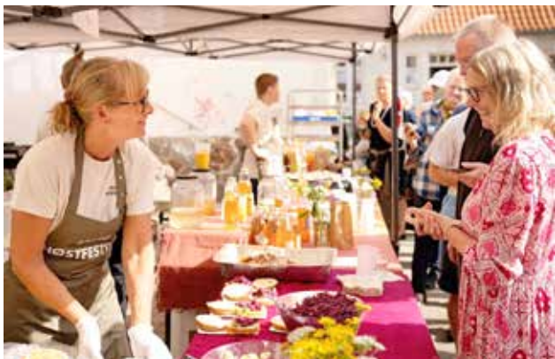
Lejre Høstfestival